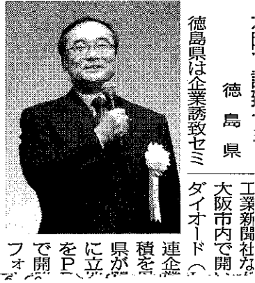
徳島県 工業新聞社大阪市内で開く「ダイオード」の積立を、県が立に。Pを開

徳島県は企業誘致セミナーを開催。大阪市内で開く「ダイオード」の積立を、県が立に。Pを開