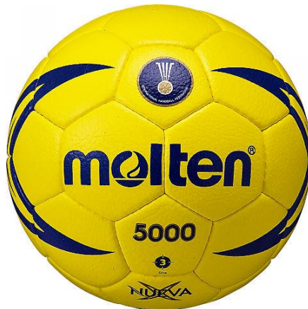
molten ホームページより

競技にはハンドボール公式試合球3号球を用いる。(直径19cm、重量425~475g)